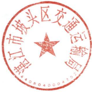
整体绩效自评基础数据表（基本情况） （2021年）