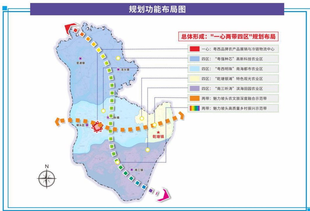
图2 坡头区推进农业农村现代化“十四五”规划总体布局图 (一) “一心”

立足坡头区自然资源、地形地貌、区位优势、产业发展等现状基础上，围绕优势产业发展格局，从区域空间上形成“一心、四片区、两带”的总体布局框架，即粤西品牌农产品展销与冷链物流中心、“粤强种芯”高新科技农业区、“粤西明珠”南海都市农业区、“乾塘银滩”特色观光农业区、“南三听涛”滨海田园农业区、魅力坡头农文旅深度融合示范带和魅力坡头高质量乡村振兴示范带。