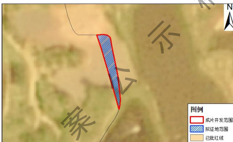
图 1 广东省实验室片区位置分布图

1、广东省实验室片区涉及拟实施征地地块面积 0.0280 公顷。该地块周边均为已报批用地，本次拟实施征地地块属于未办理手续的零星住宅地块，纳入本次成片开发方案，可完整填充周边成片已有手续地块，有利于土地的合理利用。